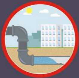
ડ્રેનેજ લાઈનની સુવિધા