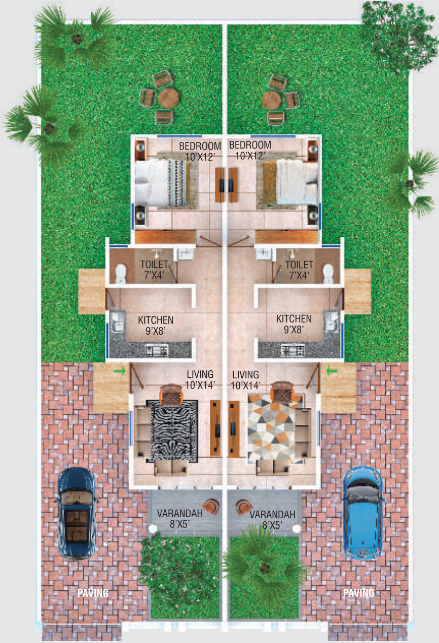
1 BHK Twin Bungalow RERA Area: 459 sqft